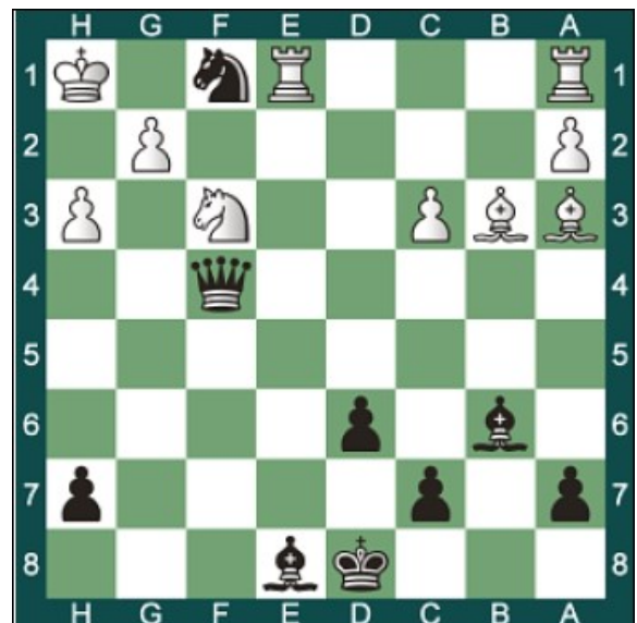
Schwarz am Zug; Matt in 2 Zügen