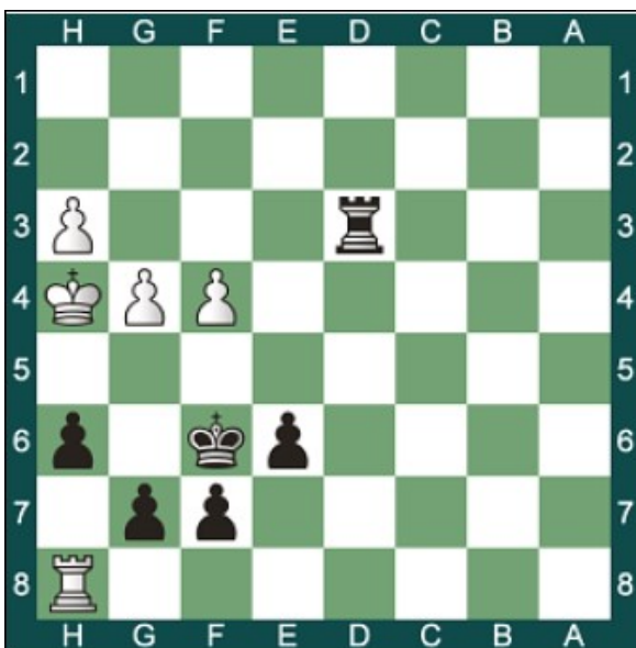
Schwarz am Zug; Matt in 3 Zügen